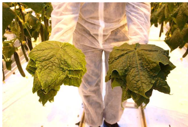
Oudste, vitale blad